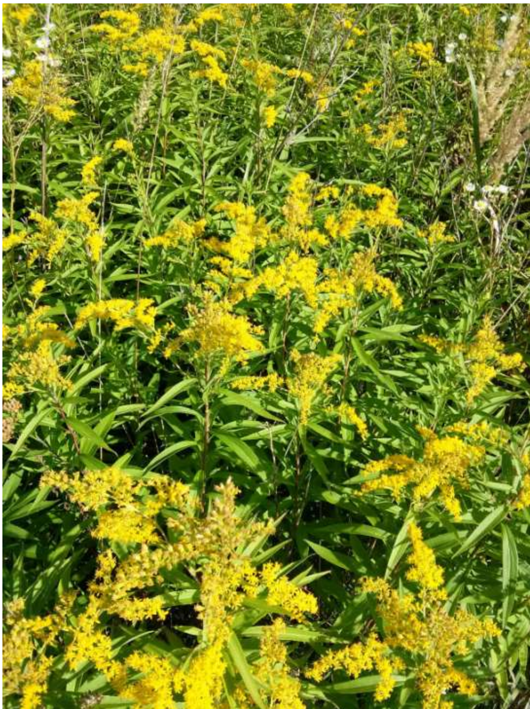
Még egy kis allergén: Kanadai aranyvessző.