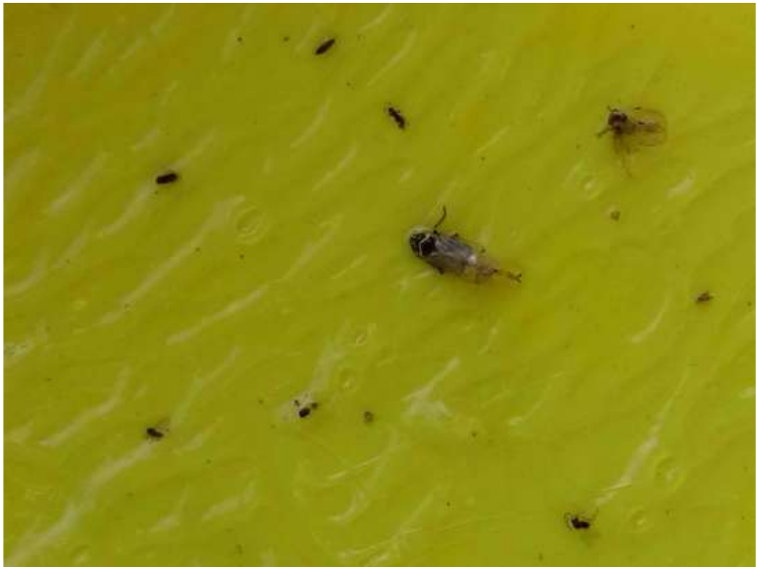
Hyalesthes obsoletus a sárgalapos csapdában.