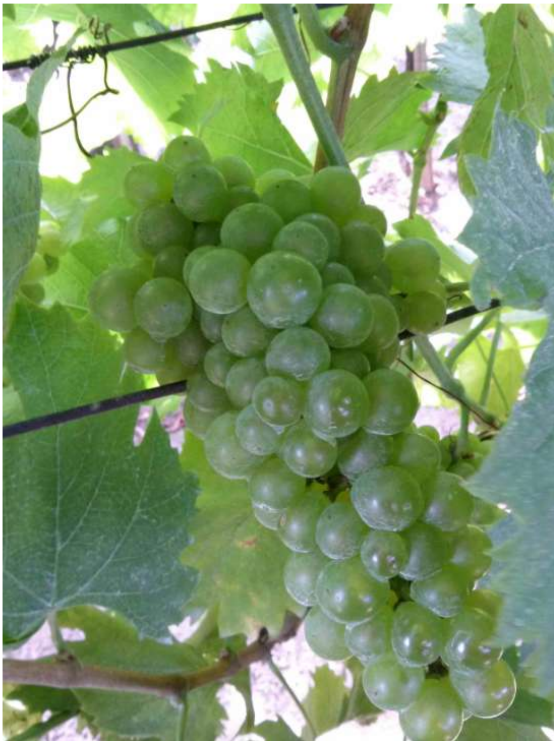
A legjobb rozsdamaró a Juhfark.