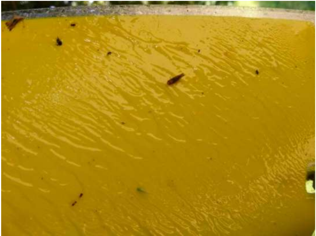
Amerikai szőlőkabóca sárgalapos csapdán.