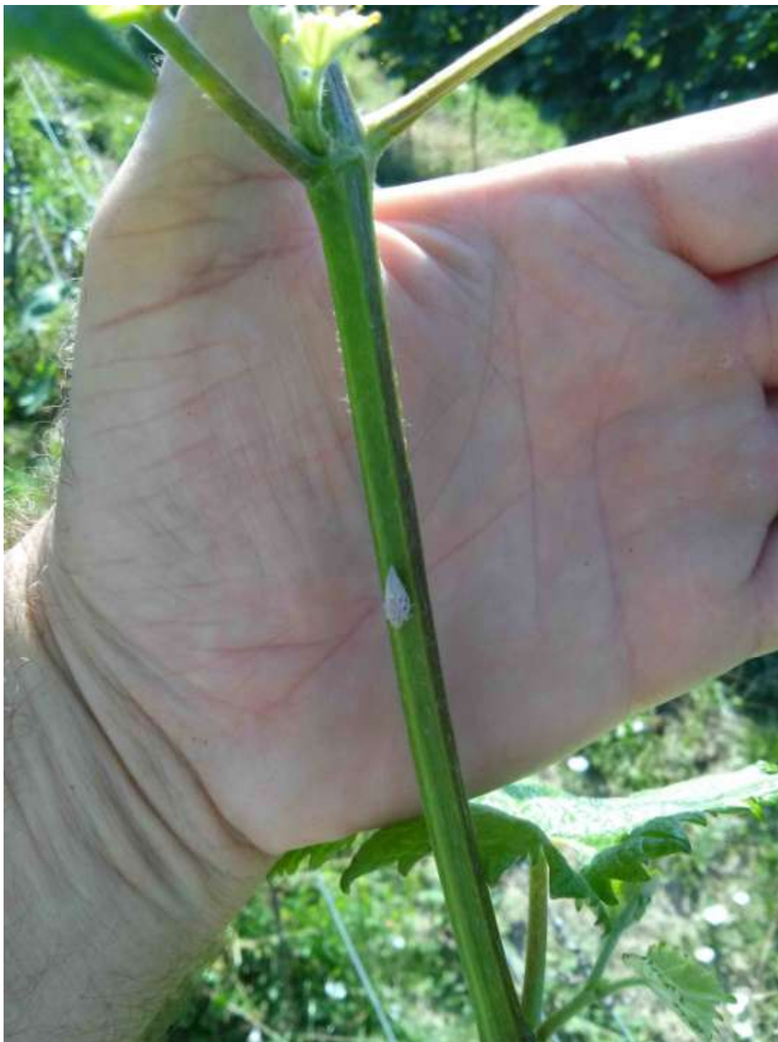
Amerikai lepkekabóca imágó szőlőhajtáson